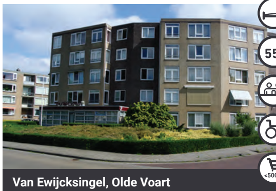
Van Ewijksingel, Olde Voart