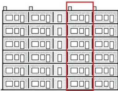
voorbeeld van een streng

Vervolgens starten de werkzaamheden in de woningen. Deze werkzaamheden worden per verticale streng uitgevoerd en duren ongeveer een werkweek. Voor de werkzaamheden in de woning moet er altijd iemand thuis zijn. Lukt dit niet dan plaatsen we een tijdelijke voordeur.