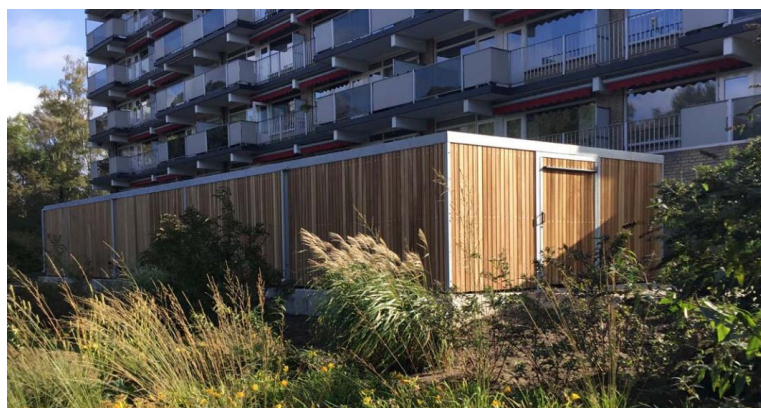
Voorbeelden van een scootmobielruimte